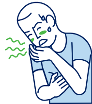
Vertiges / Nausées